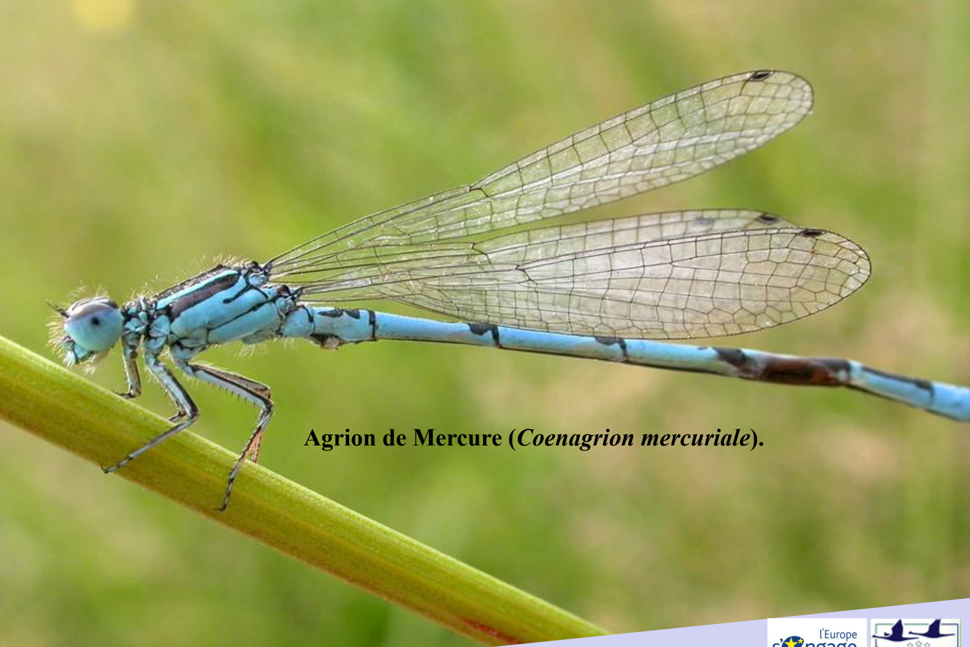
Agrion de Mercure ( Coenagrion mercuriale ).