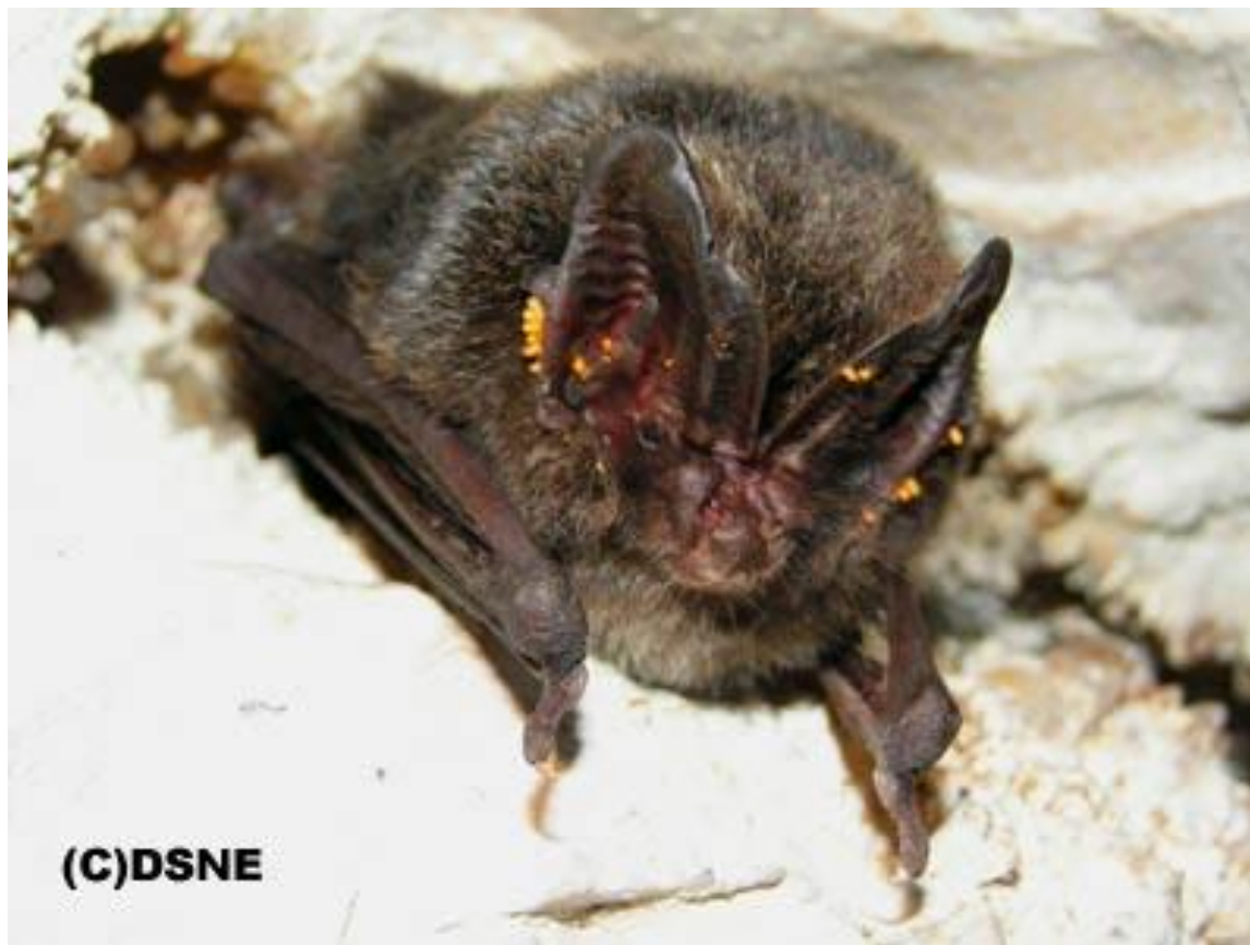
Barbastelle ( Barbastella barbastellus )