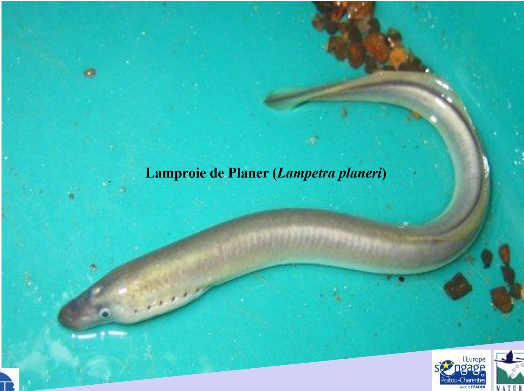
Lamproie de Planer ( Lampetra planeri )